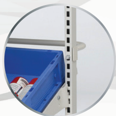
Poignée de manutention