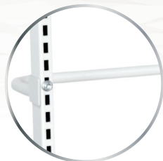
Poignée de manutention